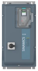
Abbeelding soortgelijk Figure similar