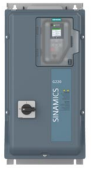
Abbeelding soortgelijk Figure similar