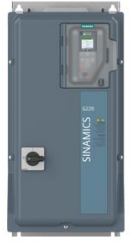
Abbeelding soortgelijk Figure similar