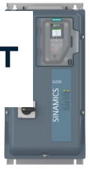
Abbeelding soortgelijk Figure similar